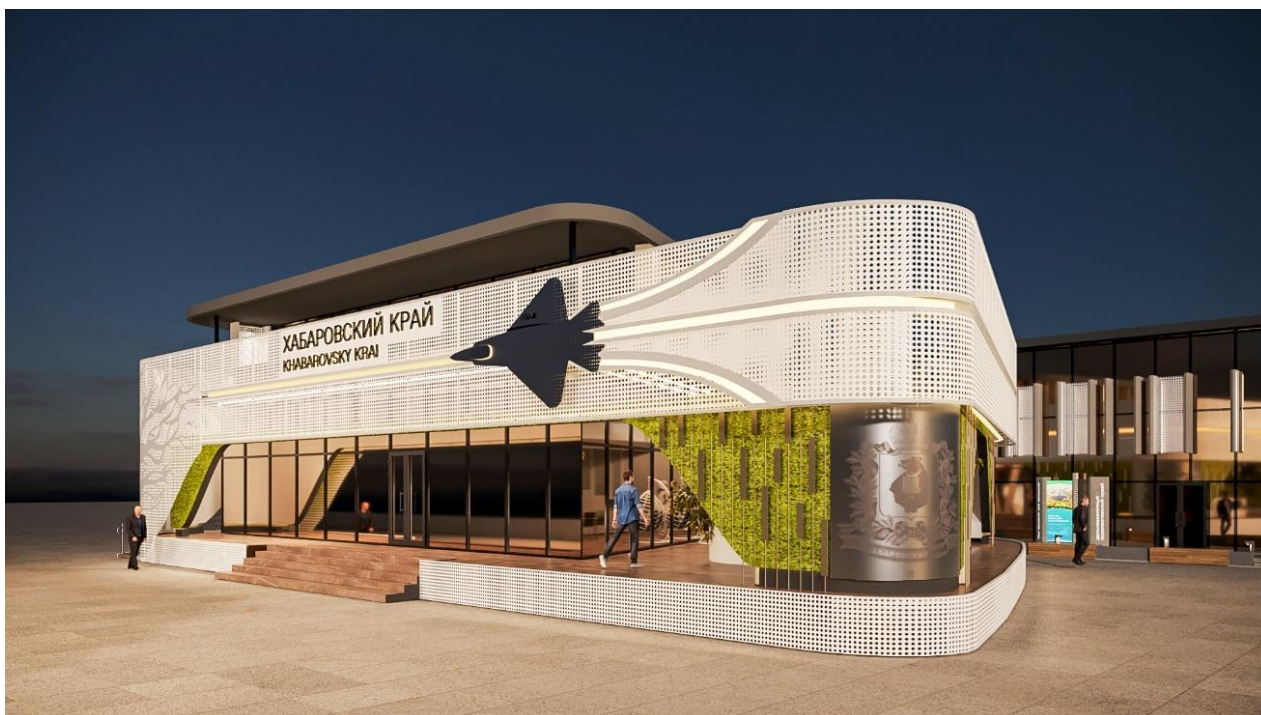
Рис. 4 – вечерний вид Выставочной экспозиции (проекция "Фасадная сторона основного здания")