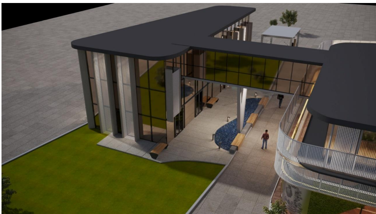
Рис. 10 – общий вид зоны "Набережная Амур" и зоны "Дальневосточный художественный музей" Выставочной экспозиции (проекция "Вид сверху")