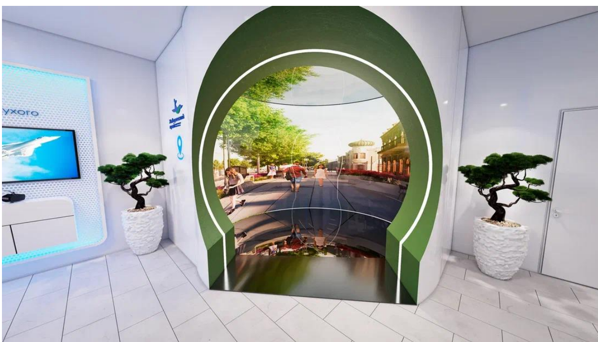
Рис. 20 – Интерактивная презентационная зона "Туризм"