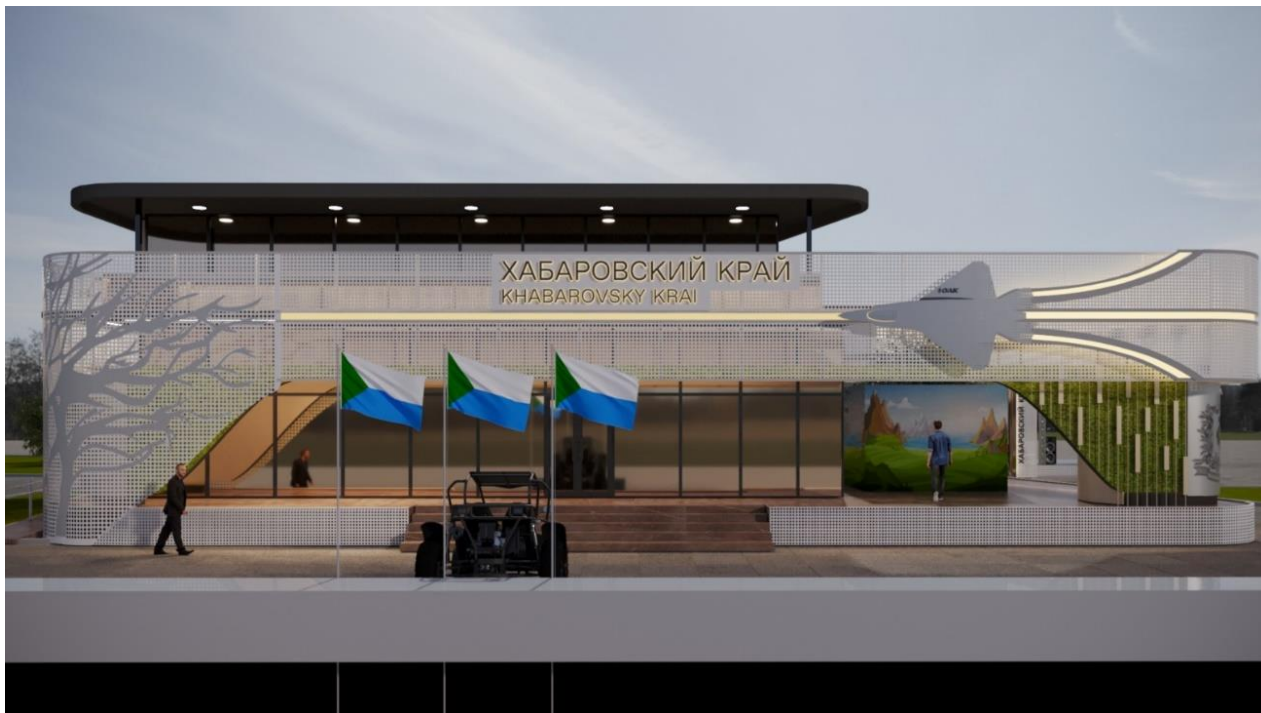
Рис. 3 – общий вид Выставочной экспозиции (проекция "Фасадная сторона основного здания")