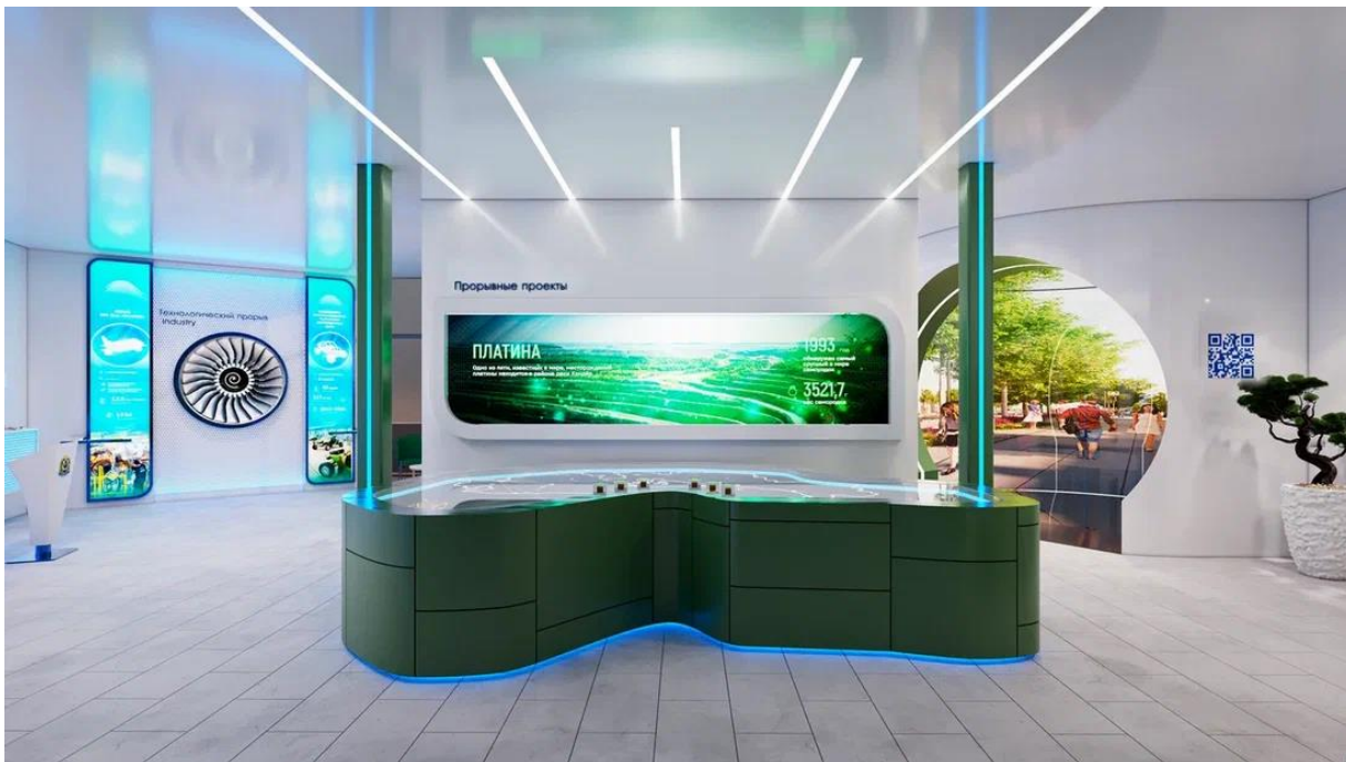
Рис. 19 – Интерактивная презентационная зона "Прорывные проекты"