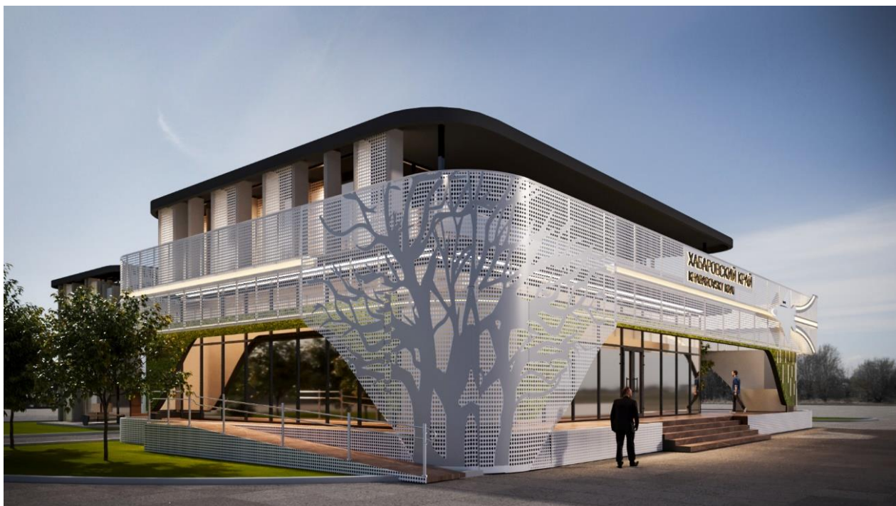
Рис. 5 – общий вид Выставочной экспозиции (проекция "Фасадная сторона основного здания")