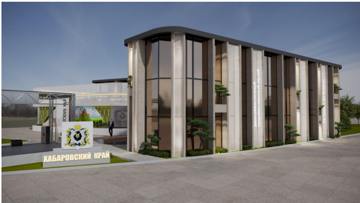
Рис. 7 – общий вид Выставочной экспозиции (проекция "Фасадная сторона дополнительного здания Выставочной экспозиции")