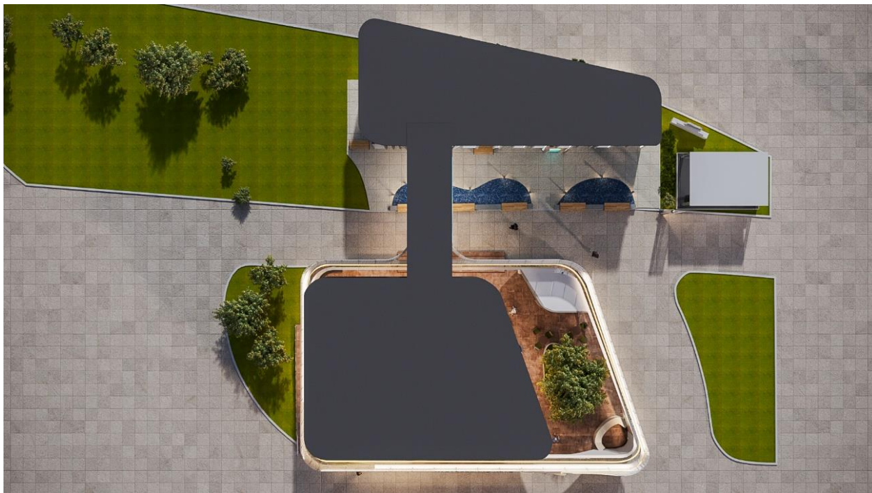
Рис. 9 – общий вид Выставочной экспозиции (проекция "Вид сверху")