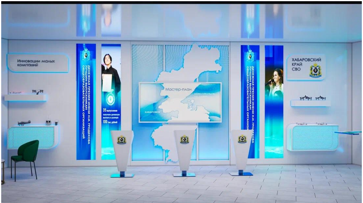
Рис. 23 - Интерактивная презентационная зона "Мастер-план" и зона Подписаний в центре, зона "Хабаровский край для СВО" справа, зона "Иновации малых компаний" слева