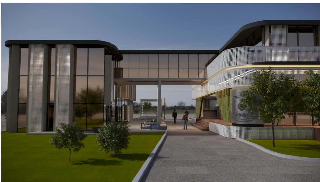
Рис. 6 – общий вид Выставочной экспозиции (проекция "Обратная сторона перехода между основным и дополнительным зданием Выставочной экспозиции")