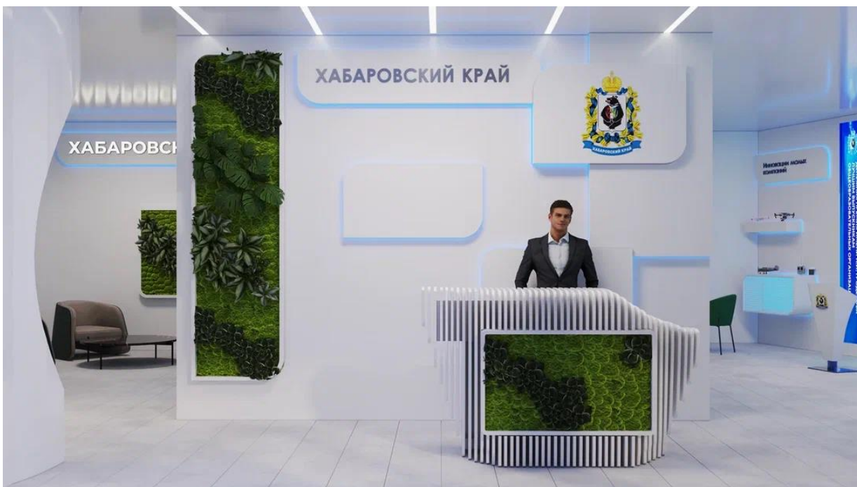
Рис. 14 – Приветственная зона