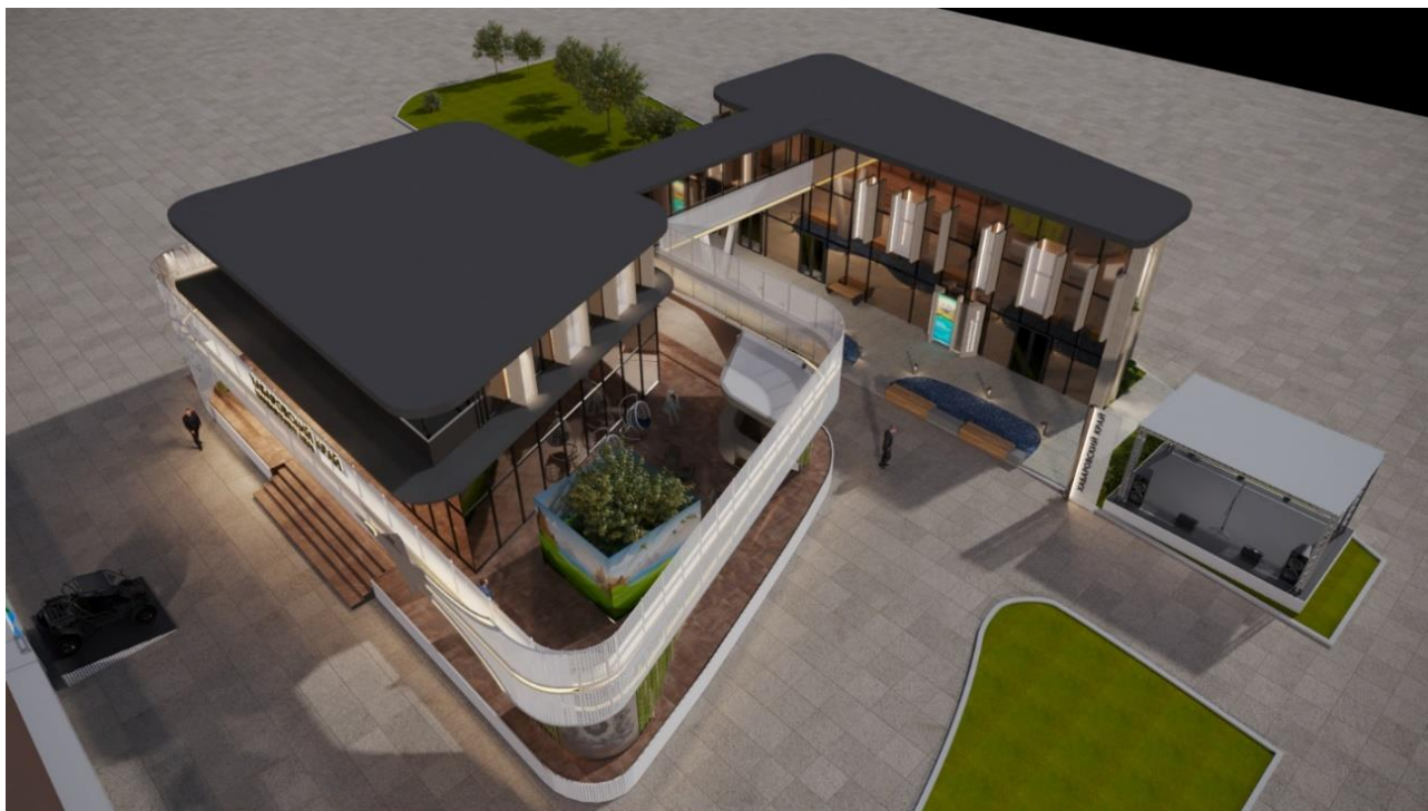
Рис. 2 – вечерний вид Выставочной экспозиции (проекция "Общий вид")