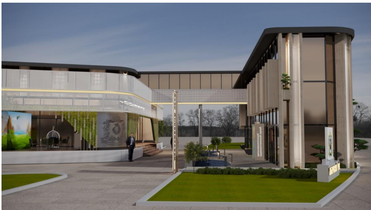
Рис. 8 – общий вид Выставочной экспозиции (проекция "Фасадная сторона перехода между основным и дополнительным зданием Выставочной экспозиции")