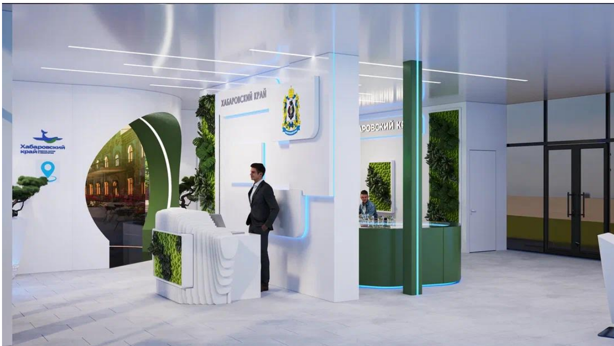
Рис. 15 – общий вид интерьера внутренней выставочной экспозиции Павильона края со стороны Приветственной зоны