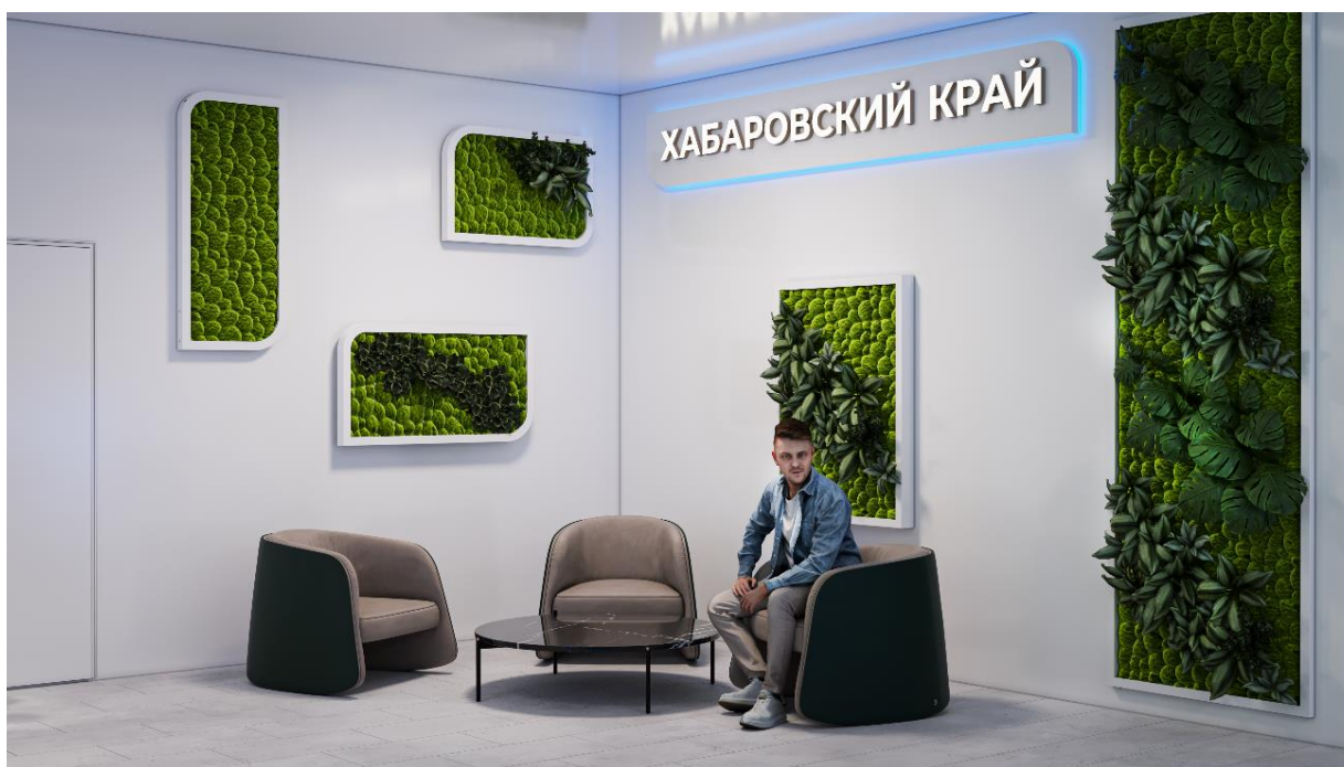
Рис. 16 – общий вид зоны отдыха внутренней выставочной экспозиции Павильона края