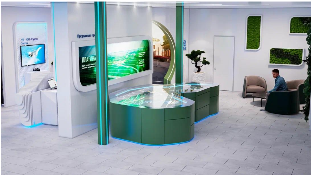
Рис. 17 – общий вид интерьера внутренней выставочной экспозиции Павильона края