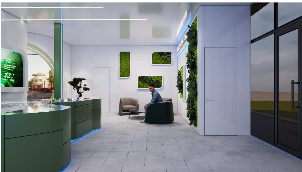
Рис. 18 – общий вид интерьера внутренней выставочной экспозиции Павильона края