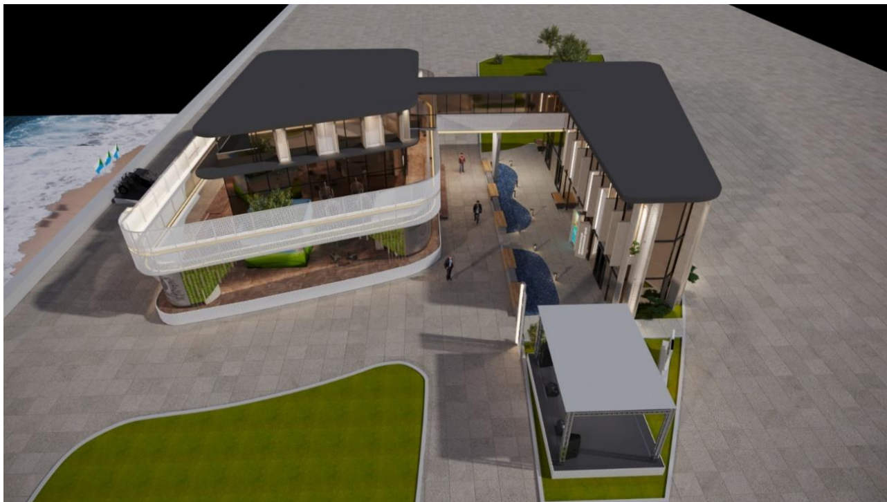
Рис. 1 – общий вид Выставочной экспозиции (проекция "Общий вид")