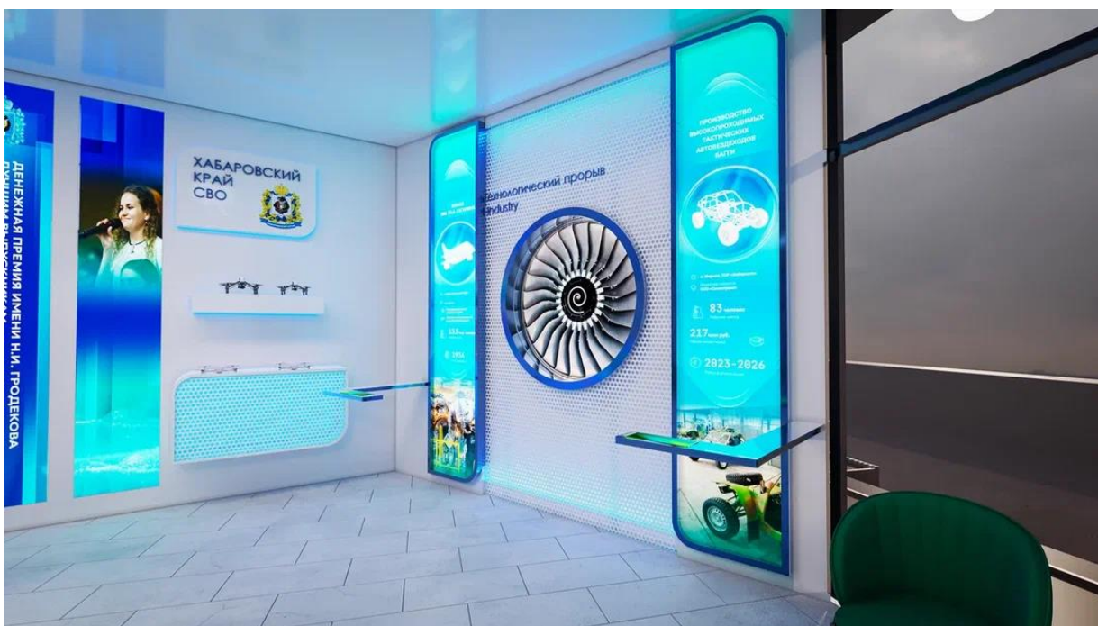
Рис. 22 – Интерактивная презентационная зона "Технологический прорыв" и зона "Хабаровский край для СВО"