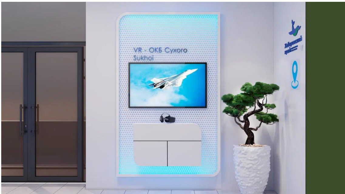
Рис. 21 – Интерактивная презентационная зона "VR Сухой"