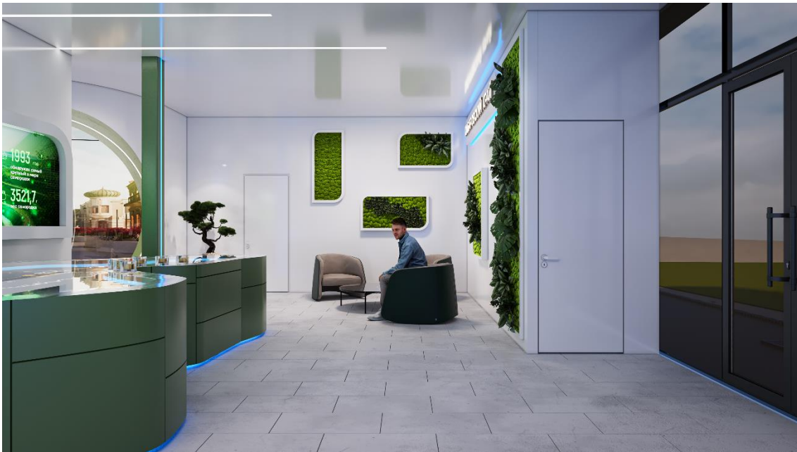
Рис. 18 – общий вид интерьера внутренней выставочной экспозиции Павильона края