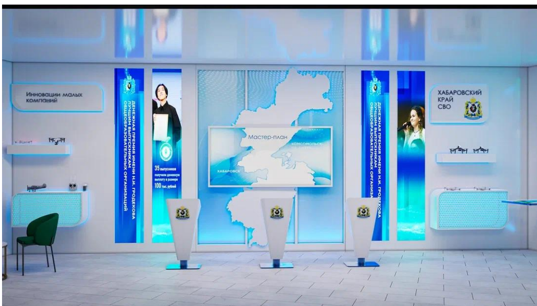
Рис. 23 - Интерактивная презентационная зона "Мастер-план" и зона Подписаний в центре, зона "Хабаровский край для СВО" справа, зона "Иновации малых компаний" слева