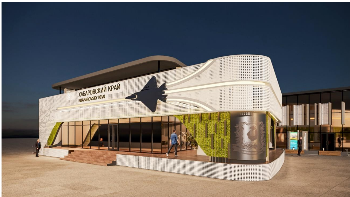
Рис. 4 – вечерний вид Выставочной экспозиции (проекция "Фасадная сторона основного здания")