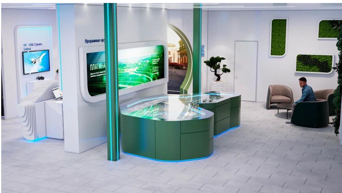
Рис. 17 – общий вид интерьера внутренней выставочной экспозиции Павильона края