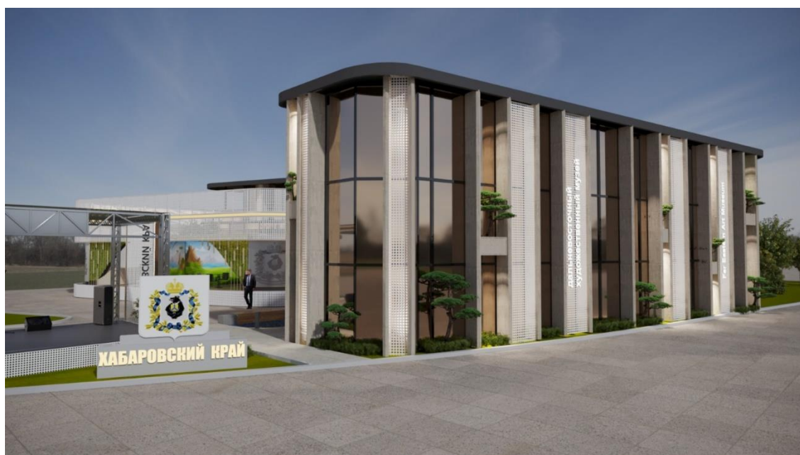
Рис. 7 – общий вид Выставочной экспозиции (проекция "Фасадная сторона дополнительного здания Выставочной экспозиции")