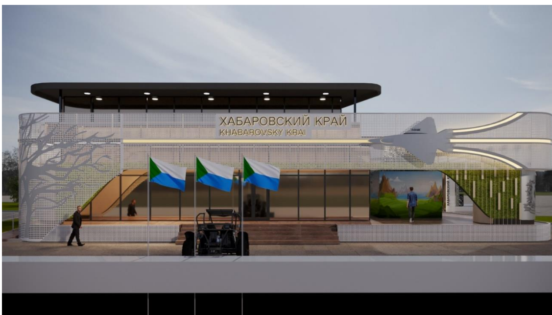
Рис. 3 – общий вид Выставочной экспозиции (проекция "Фасадная сторона основного здания")