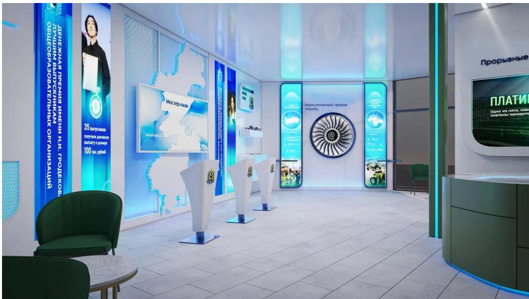
Рис. 24 – общий вид интерьера внутренней выставочной экспозиции Павильона края