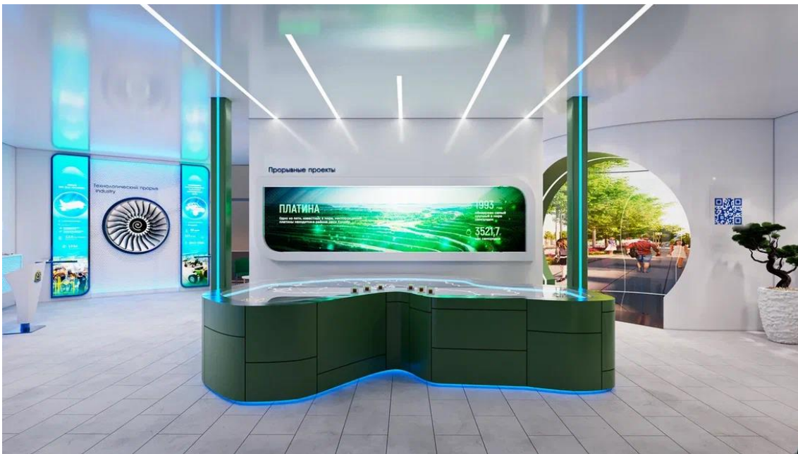
Рис. 19 – Интерактивная презентационная зона "Прорывные проекты"