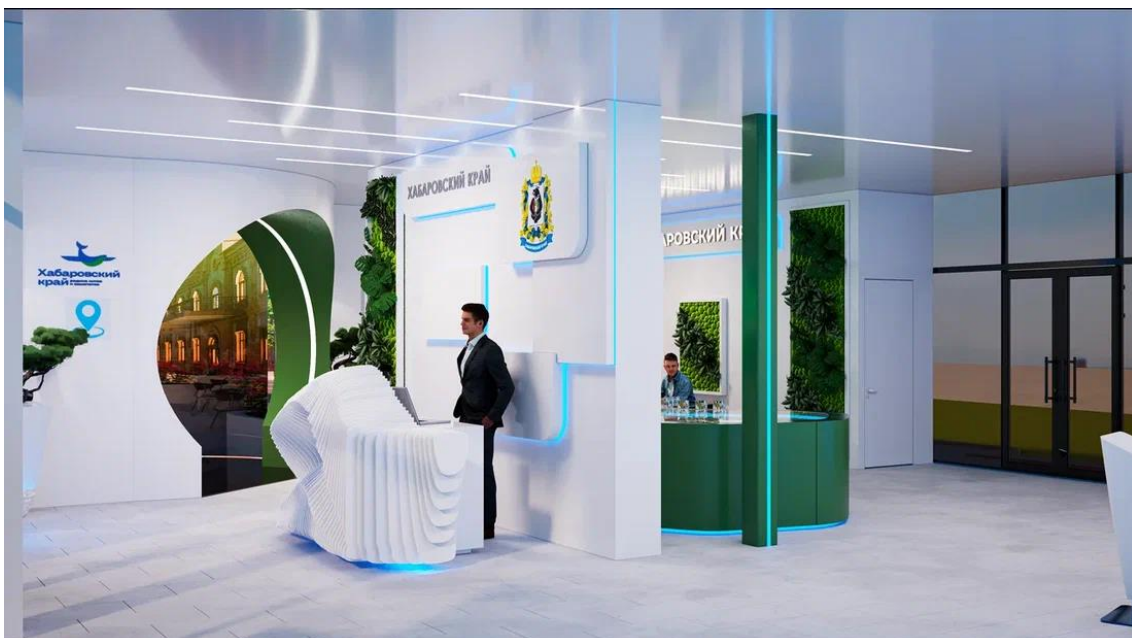
Рис. 15 – общий вид интерьера внутренней выставочной экспозиции Павильона края со стороны Приветственной зоны