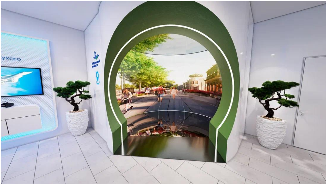
Рис. 20 – Интерактивная презентационная зона "Туризм"