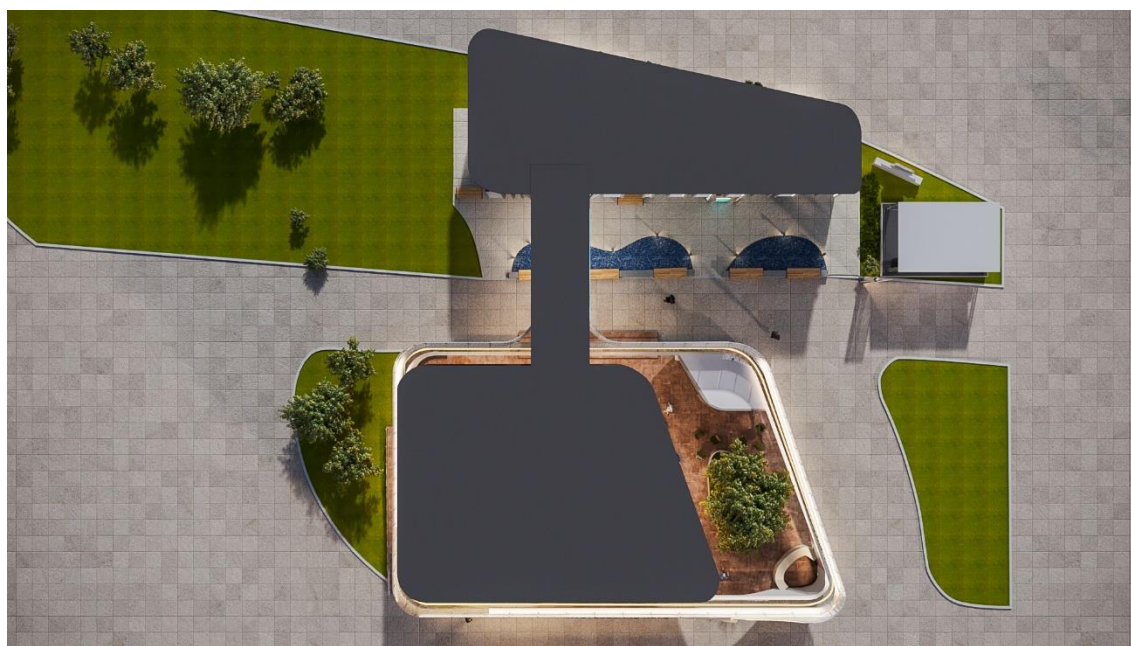
Рис. 9 – общий вид Выставочной экспозиции (проекция "Вид сверху")