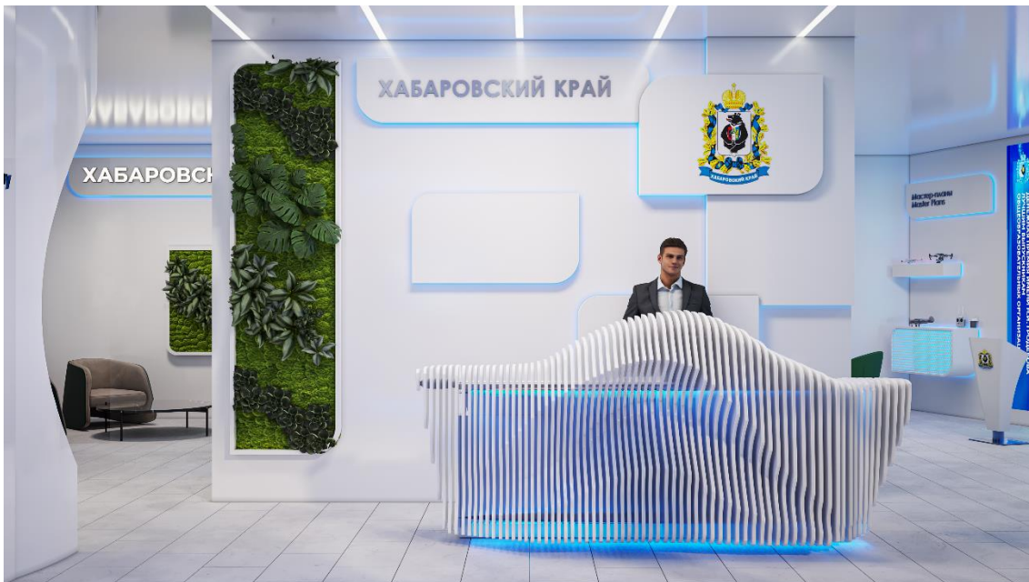
Рис. 14 – Приветственная зона