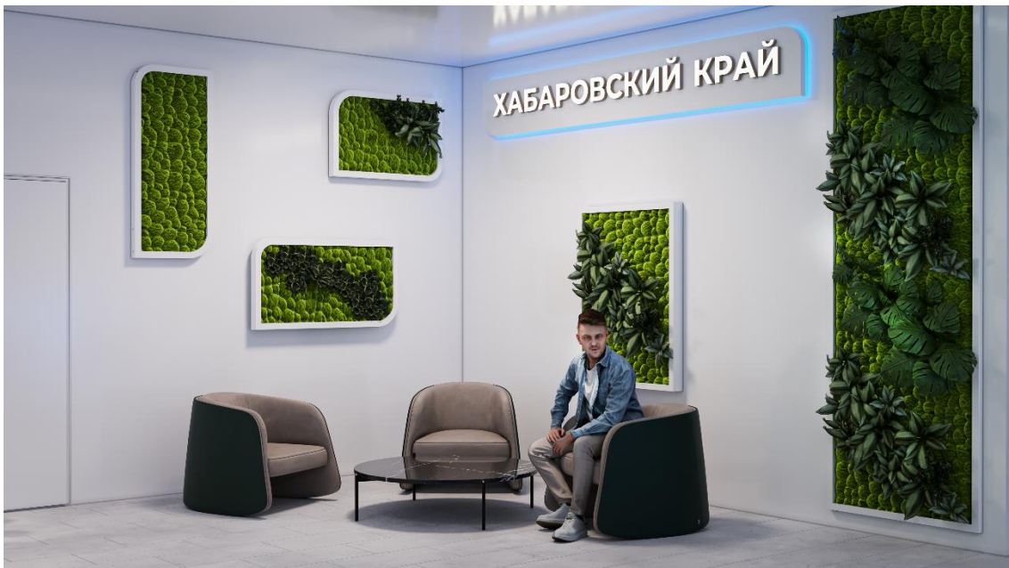
Рис. 16 – общий вид зоны отдыха внутренней выставочной экспозиции Павильона края