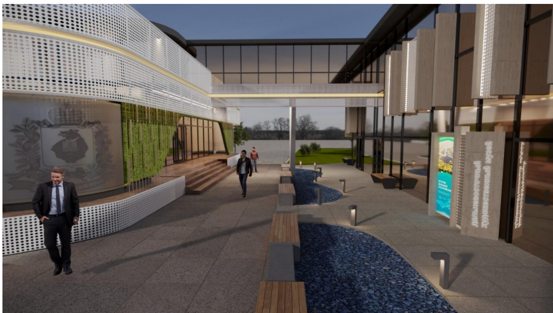
Рис. 12 – общий вид зоны "Набережная Амур"