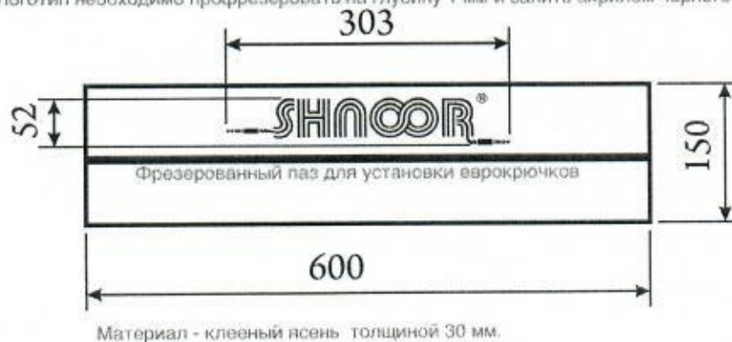
Эскиз логотипа Получателя услуг

Логотип необходимо профрезеровать на глубину 1 мм и залить акрилом чёрного цвета