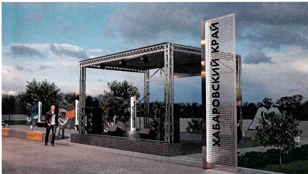
Рис. 3 – общий вид Сценической площадки Павильона края (вид спереди)