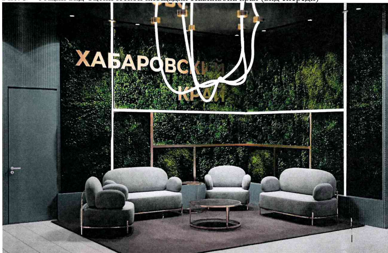
Рис. 4 – общий вид интерьера Мягкой зоны внутренней выставочной экспозиции Павильона края