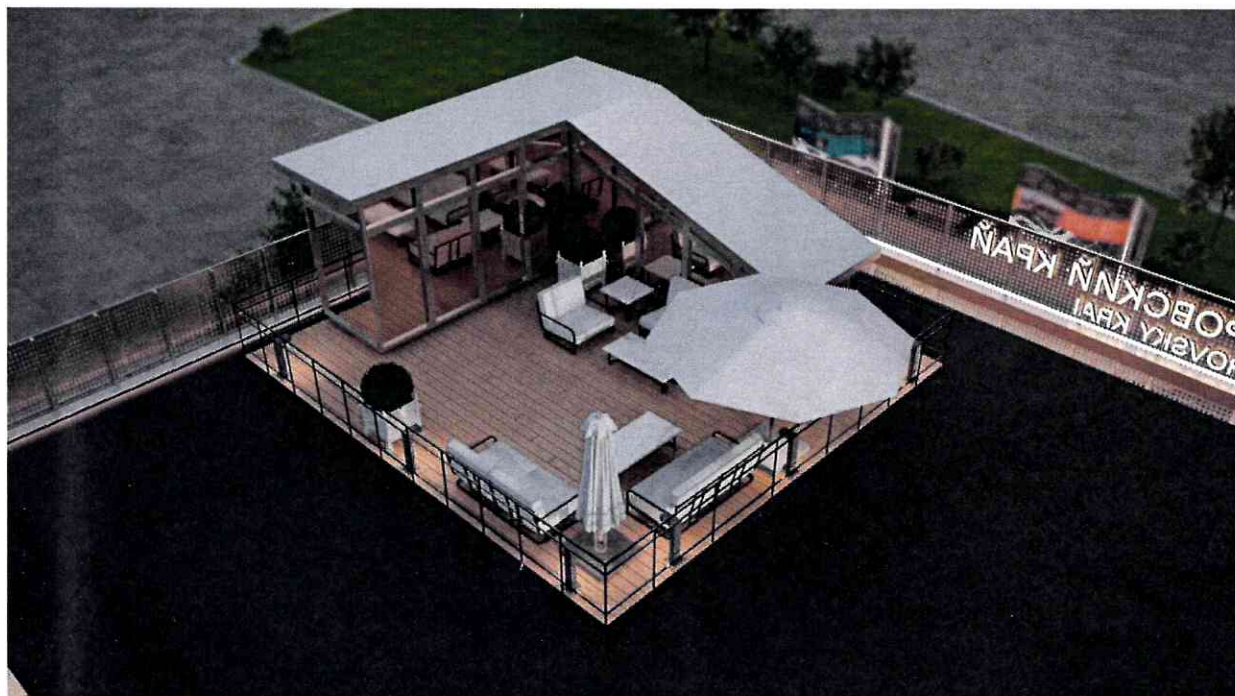
Рис. 1 – общий вид "Лаундж-зоны" на эксплуатируемой крыше

3.1. Выставочный павильон Хабаровского края (далее – Павильон края) организуется в рамках выставки "Улица Дальнего Востока" VII Восточного экономического форума (далее – Выставка, Форум соответственно). Представленная визуальная концепция является предварительной. Допускается изменение отдельных элементов представленных изображений и экспозиционных зон (иных выставочных объектов) с целью улучшения внешнего вида Павильона края по согласованию с Заказчиком.